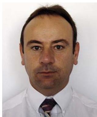
2 ème vice-président