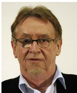
1 er vice-président

Le conseil d'administration peut déléguer ses attributions au bureau, à l'exception des délibérations relatives à l'adoption du budget et du compte administratif. Le bureau est composé du président, de trois vice-présidents, et, le cas échéant, d'un membre complémentaire. Afin de faciliter le processus de décision, il se réunit mensuellement.