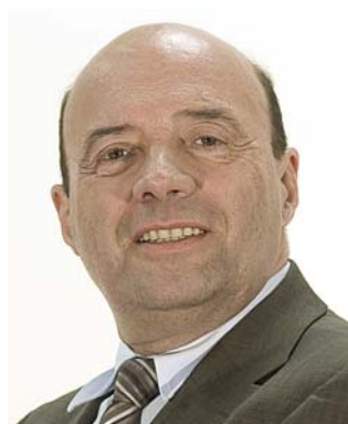
3 ème vice-président