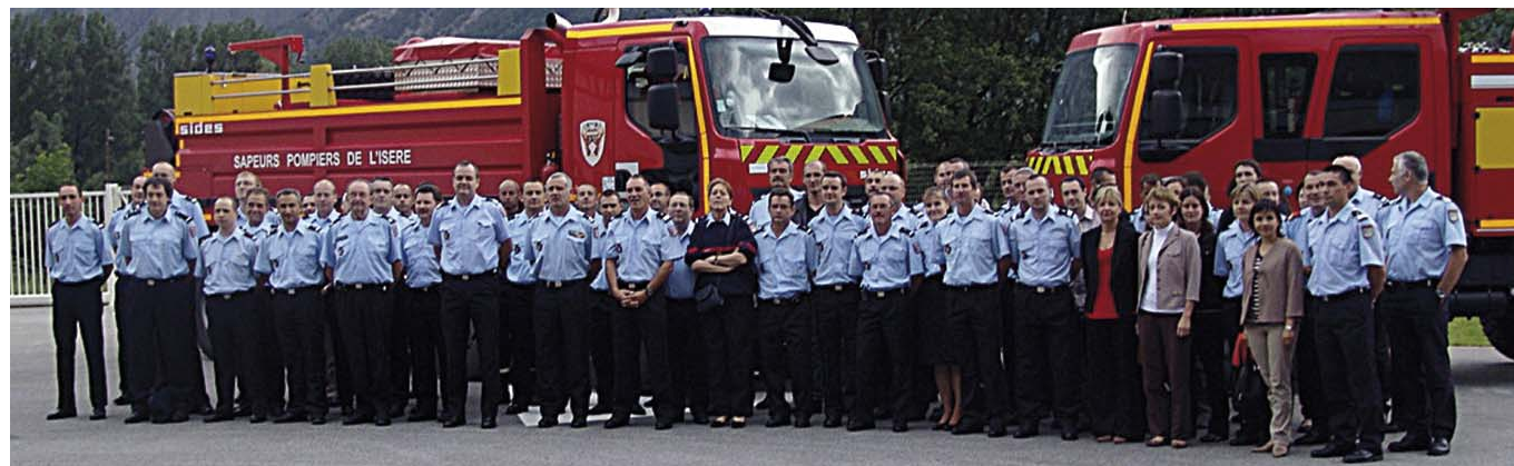
Réunion des chefs de centre du groupement 4 - 9 juin 2008 - Bourg d'Oisans