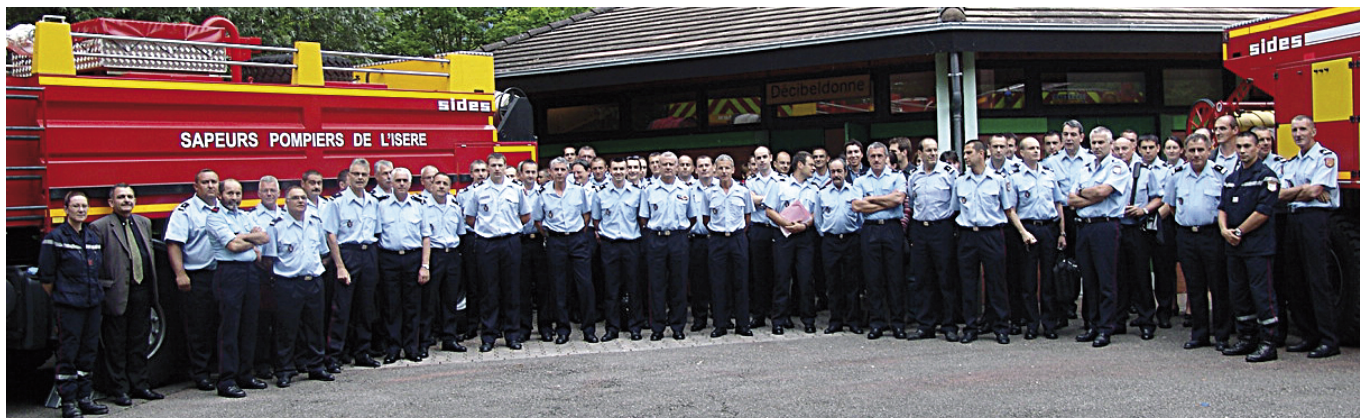
Réunion des chefs de centre du groupement 3 - 4 juin 2008 - Meylan